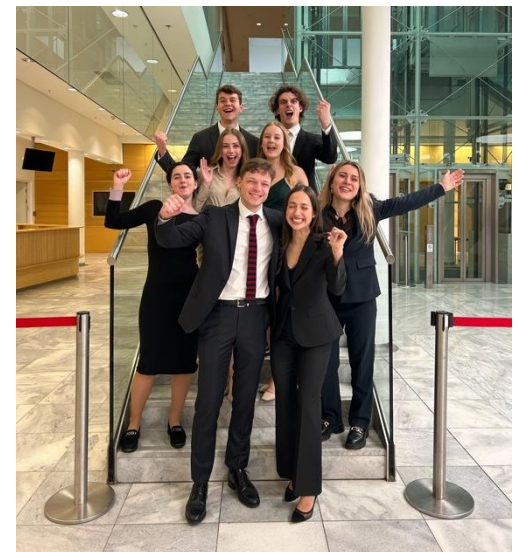
Closing Ceremony in Wien