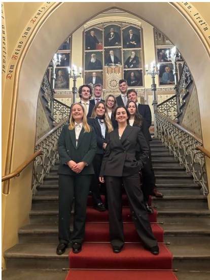
Pre-Moot in Riga