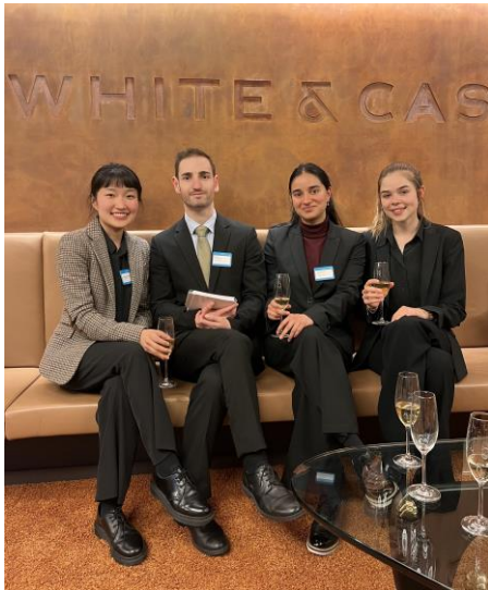
Pre-Moot in Brüssel