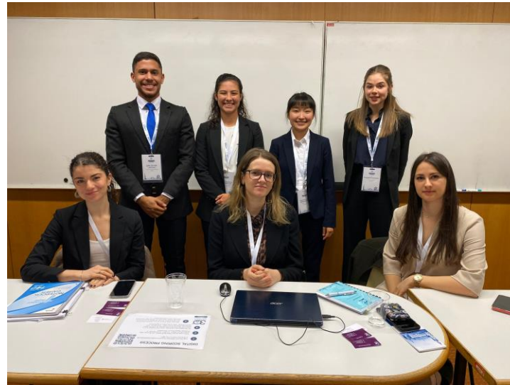
Finale Hearings in Wien