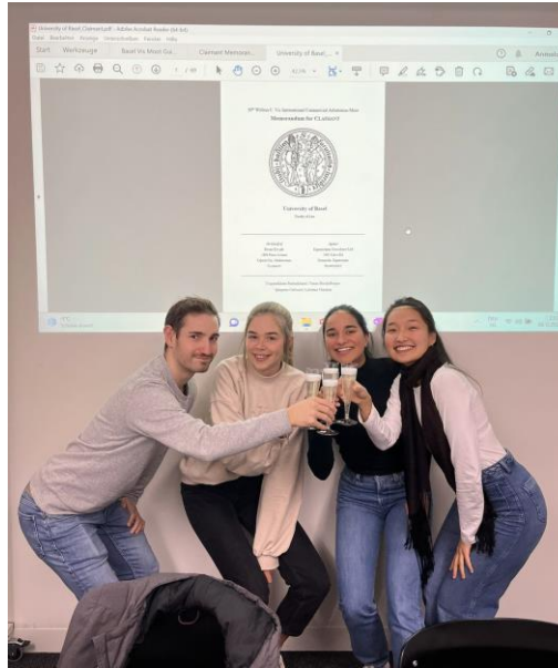
Abgabe Memorandum for Claimant