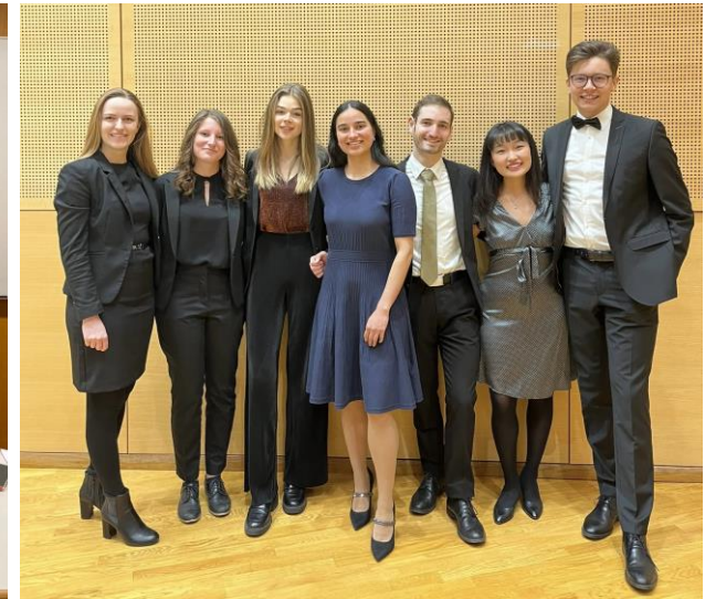
Closing Ceremony in Wien