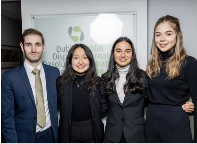
Pre-Moot in Dublin